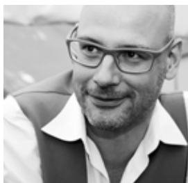
DENCI-STUDIO, Bart Cobbaert, Gent