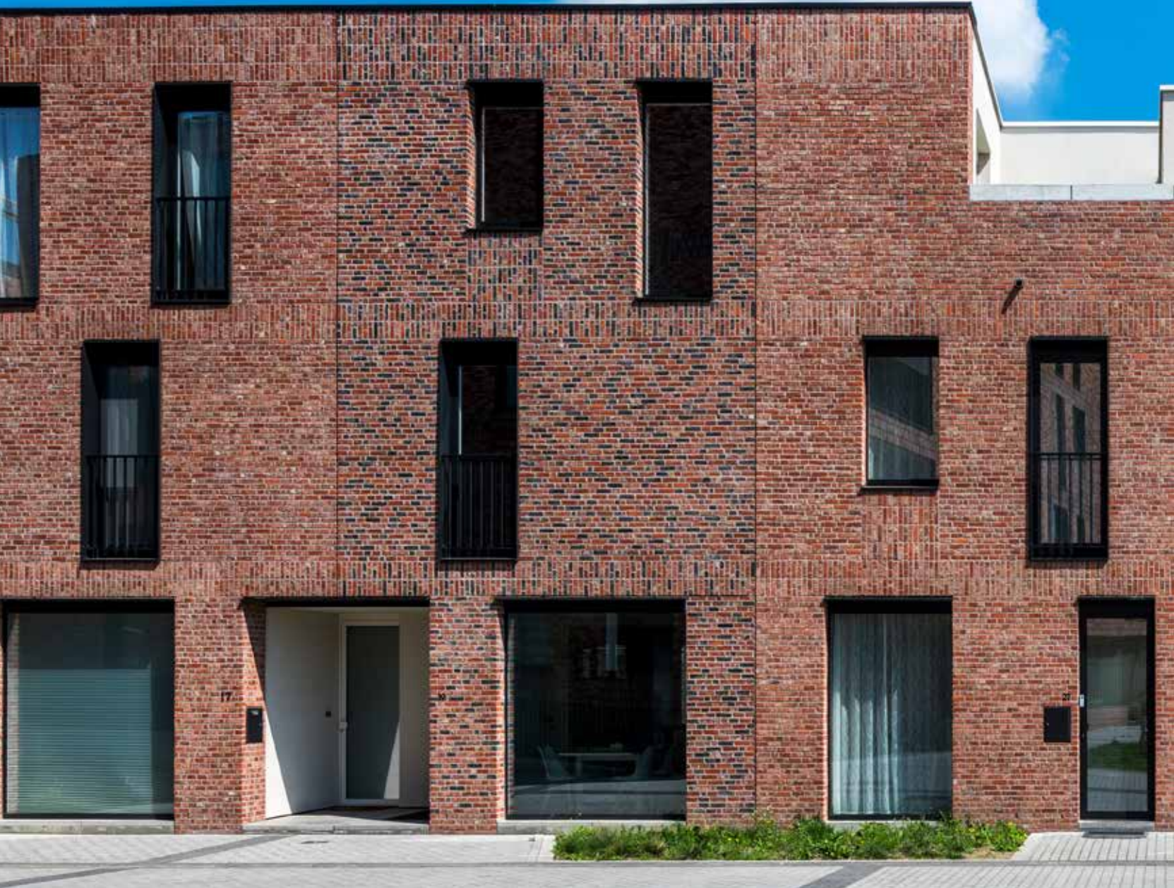
Brick-mix met Terca Artiza gevelstenen