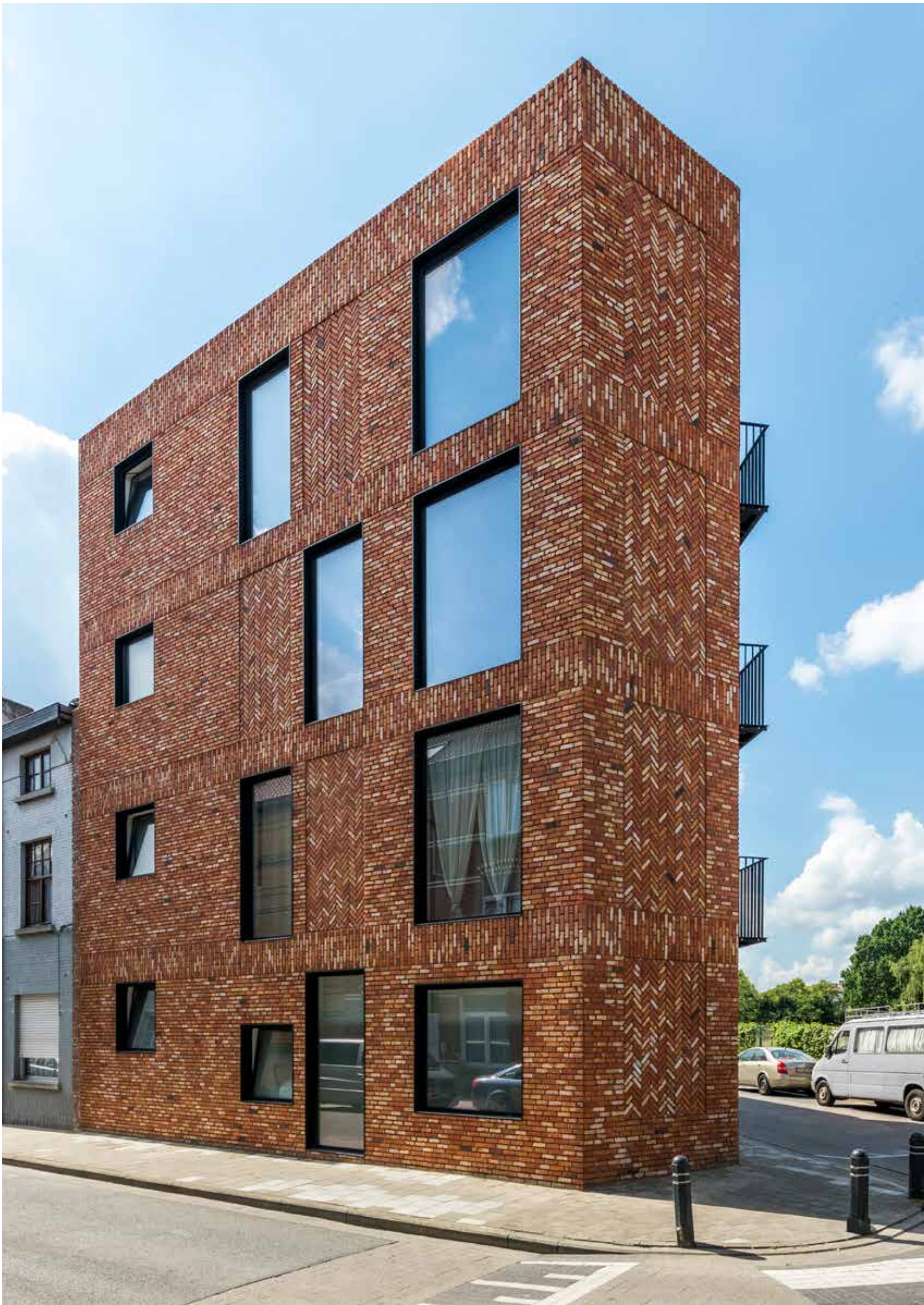
Terca Recup Molenlandse Rijnvorm