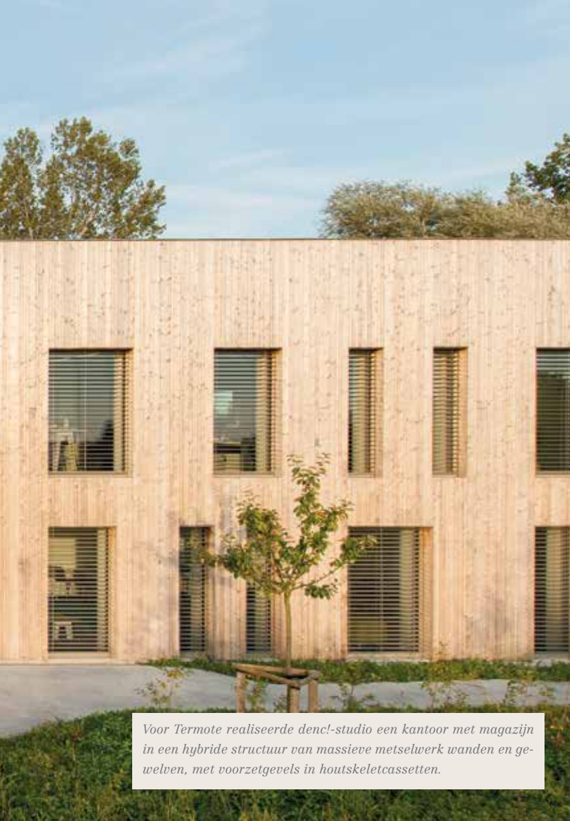
Voor Termote realiseerde denc!-studio een kantoor met magazijn in een hybride structuur van massieve metselwerk wanden en gewelven, met voorzetgevels in houtskeletcassetten.

plek. De enige voorwaarde is dat ik daar zes maanden per jaar aanmeer. Voor de rest kan ik vrij het ruime sop kiezen. Omdat een architect te veel werkt en zijn vrienden te weinig ziet, heb ik al een ronde van België georganiseerd, waarbij ik elke dag een andere vriend oppikte. Die moest eerst de vorige gast naar zijn of haar auto voeren en mocht dan een dag meevaren. Onderweg beleef je de meest verrassende avonturen. Op de scheepslift van Strépy word je bijvoorbeeld 76 meter omhoog getild. Op tijd en stond kun je ook de eerder industriële omgeving van Gent inruilen voor bijvoorbeeld Wachtebeke, waar je alleen koeien, kajakkers, mountainbikers en ruiters ziet.”